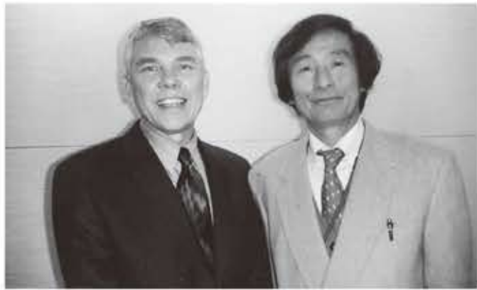
第1回 点滴療法研究会にて

研究会に参加して、アメリカで行われている超高濃度ビタミンC点滴を京滋地区で最初に開始しました(2008年春)。